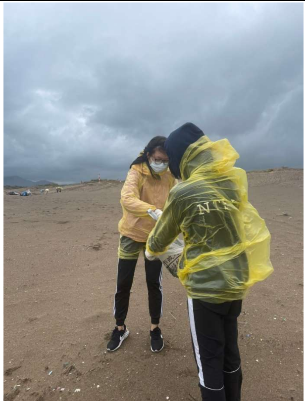
同學互相幫忙，一人拿垃圾袋一人拿夾子