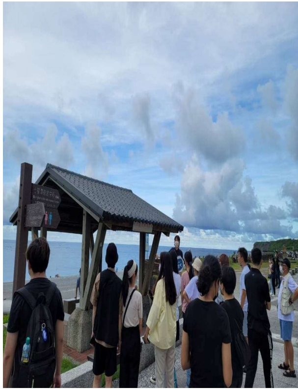
洄游吧介紹七星潭